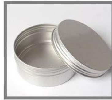
Posuda sa poklopcem